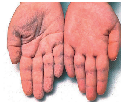
Abbildung 1 Von den beiden dargestellten Händen hat die (bildmäßig) linke Hand nicht mehr als drei Minuten unter Wasser gelegen.

Thomas JM, Durack A, Sterling A, Todd PM, Tomson N. Aquagenic wrinkling of the palms: a diagnostic clue to cystic fibrosis carrier status and non-classic disease. Lancet 2017; 389: 846