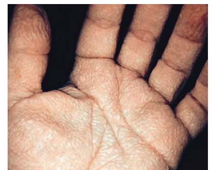
Abbildung 2 Unter ultraviolettem Licht sieht man das Waschfrauenhände-Phänomen noch intensiver: Faltenbildung und moderates Ödem